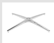
19 Base 4 razze in alluminio lucidato. 4-spoke base made of polished aluminum.