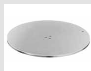
22 Base a disco in acciaio inox cromato. Disk base made of stainless chrome steel.