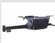
O5 Meccanismo oscillante con fulcro avanzato e 5 posizioni di blocco e regolazione laterale di tensione. Oscillating mechanism with advanced pivot and 5 blocking positions and lateral tension adjustment.