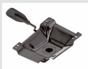
M2 Plastra leva gas in acciaio verniciato nero. Gas lift made of black-painted steel.