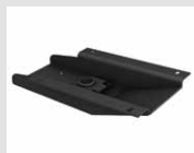
M4 Plastra fissa girevole in acciaio verniciato nero. Fixed and revolving plate made of black-painted steel.