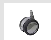
W6 Ruota cromata gommata autofrenante con battistrada morbido Ø65. Self-braking chrome rubber castor with soft tread Ø65.