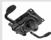
O1 Meccanismo oscillante con 4 posizioni di blocco. Oscillating mechanism with 4 blocking positions.