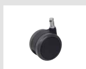
W4 Ruota gommata autofrenante con battistrada morbido Ø65. Self-braking rubber castor with soft tread Ø65.