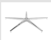
18 Base piramidale in alluminio lucidato. Pyramidal base made of polished aluminum.