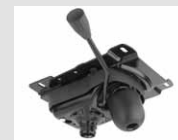
O2 Meccanismo oscillante libero. Free oscillating mechanism.