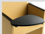
Tavoletta scrittoio antipanico in polipropilene Polypropylene anti-panic writing tablet