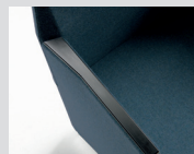
Copri bracciolo in poliuretano Polypropylene arm pad