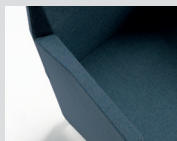
Senza copri bracciolo Without arm pad