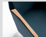
Copri bracciolo in legno Wooden arm pad