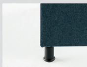
Piedini fissi Fixed slides