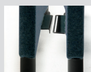
Aggancio sedute Linking device