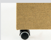
Ruote piroettanti Swivel castors