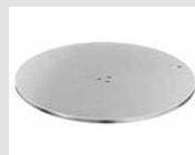
22 Base a disco in acciaio inox cromato. Disk base made of stainless chrome steel.