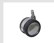
W6 Ruota cromata gommata autofrenante con battistrada morbido Ø65. Self-braking chrome rubber castor with soft tread Ø65