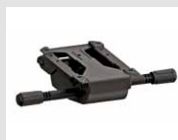
S9 Meccanismo synchron con 4 posizioni di blocco. Synchron mechanism with 4 blocking positions.